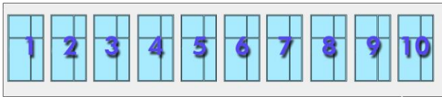
Abbildung 1 Anordnung der Fenster in der Süd-Ostfassade (Innenansicht)

Im Rahmen der Sanierung wurden die bisherigen blinden Fenster in der Süd-Ostfassade durch neue Fensterelemente mit Kunststoff-Rahmenprofil und dreifach Isolierglas mit Edelgasfüllung und Wärmeschutzbeschichtung ersetzt. Mit Ihrer Spende verringern Sie unsere Fremdvverschuldung. Als Gegenleistung beschriften wir Ihr Fenster mit dem Schriftzug: «gespendet von Ihr Name, Ort ».